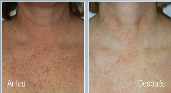
Un mes después de un tratamiento.