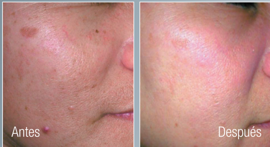
Después de un tratamiento.